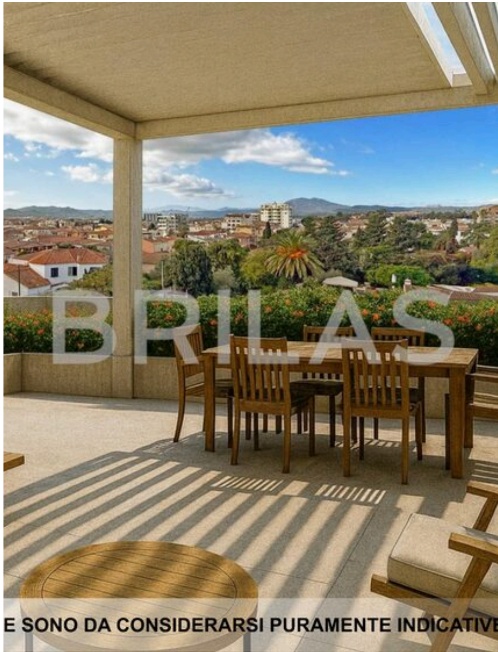
IMMAGINI PROPOSTE SONO DA CONSIDERARSI PURAMENTE INDICATIVE E NON VINCOLANTI